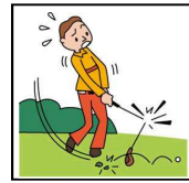
ゴルフクラブの破損