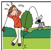
ゴルフ中の賠償事故